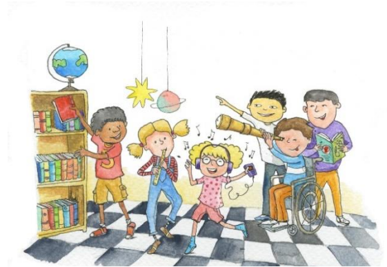
Imagem cortesia de Commissioner for Children's Rights (Ilustrador: Lida Varvarousi)

O Evento Multiplicador Nacional começa às 09:00 e acaba às 15:00 (GMT+3). Na primeira parte, irá ser feita uma apresentação geral do projeto CICADA e dos principais produtos, enquanto que na segunda parte, os participantes irão ter a oportunidade de participar em workshops paralelos realizados durante uma hora e meia cada. Durante a primeira ronda (11:00-12:30), serão realizados 3 workshops com base nos capítulos 1, 2 e 6 (ver acima). Similarmente, durante a segunda ronda (13:00-14:00) serão oferecidos três workshops com base nos capítulos 3, 4 e 5 (ver acima). Cada participante irá escolher um workshop para participar em cada ronda durante a sua inscrição online.